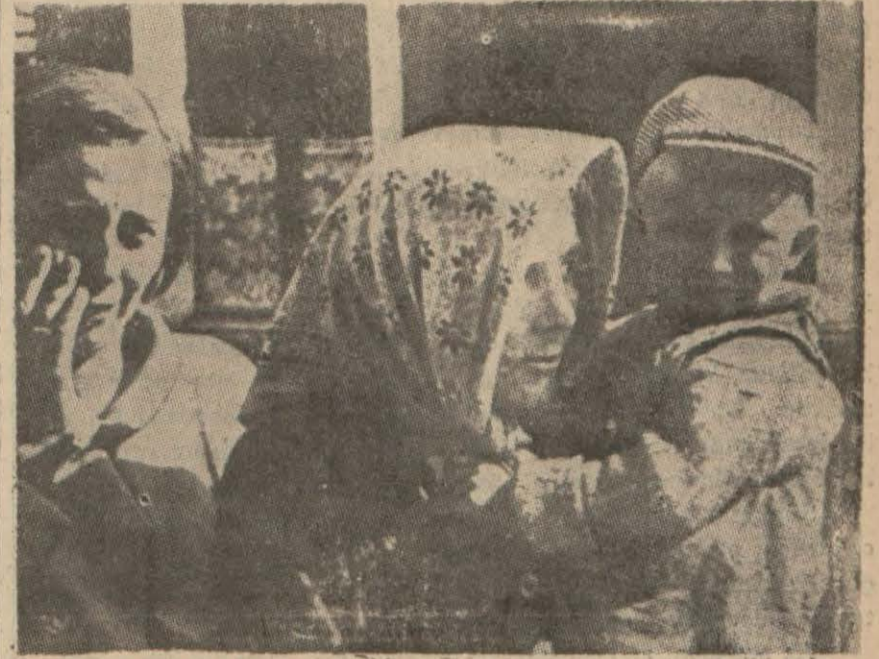
Hürriyeti elinden alman vatanlarına ve topraklarını müdafaa ederken ölen erkeklerine ağlayan Leh kadımları...

İngiliz imparatorluk genelkurmay başkanı Sir Edmund Ironside ve hava mareşali Sir Giril Nevill, dün günün meselelerini müzakere için müttefik ordular başkumandanı general Gamelin, Fransız hava kuvvetleri kumandanı general Vuillemin ve yüksek askeri şûra azasından general Georges ile bir görüşme yapmışlardır.