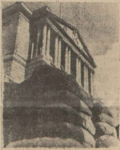
İngilterenin en büyük kuvveti olan altınbaccın bulunduğu İngilizlere bankası binası kum torbaları muhafaza altında...