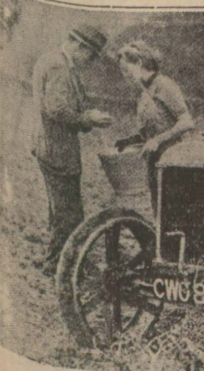
İngilterede erkeklerin yerine tarlalarda çalışan kadınlar...

Londra, 6 (A.A.) — Londra belediyesi reisi bugün Türk askerî heyeti şerefine, Mansion House'de büyük bir öğle ziyafeti vermiştir. Bu ziyafette birçok yüksek devlet ricali, ezcümle mareşal Lord Birdwood, hariciye müsteşarı Butler, harbiye müsteşarı Lord Cobham ve Türkiyenin Londra büyük elçisi Dr. Tevfik Rüşti Aras hazır bulunmuştur.